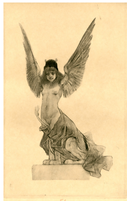
Félicien Rops, Parallèlement (La Sphinge) , 1889, héliogravure rehaussée de crayon brun, 33,6 x 21,11 cm. Coll. musée Félicien Rops, Province de Namur, inv. PER E437 1P.